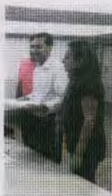
El candidato, ayer.

● La presidenta de la Junta apoya hoy en un acto al nuevo candidato socialista