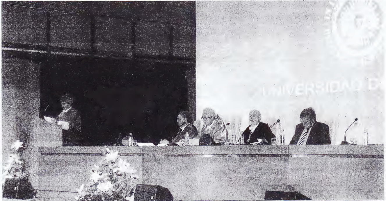
El secretario de la Universidad de cuenta de la Memoria del curso académico 2013-2014 en el inicio de apertura oficial del presente curso académico.